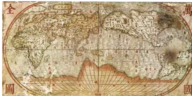
Karte des Matteo Ricci, 1600 (Mailand, Biblioteca Ambrosiana)