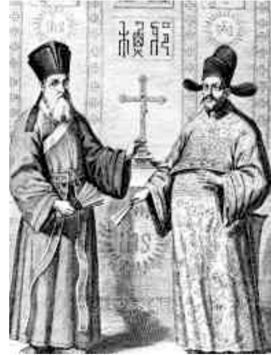
Matteo Ricci und der Konvertit Xu Guangqi (Kupferstich, A. Kircher, China illustrata)